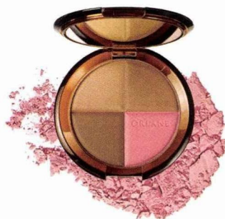
Faut que ça brille Poudre multi-soleil, Orlane, 32 €