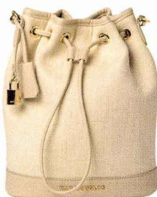
La main dans le sac Petit sac seau en lin, Mac Douglas, 175 €