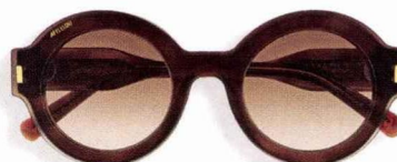
Plein soleil Lunettes de soleil Perspicate, Affelou, 199 € la monture + deux clips + une chaînette à lunettes