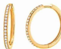
Entrez dans la ronde Boucles d'oreilles créoles en or jaune, Courbet, 1 700 €