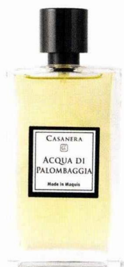
Le grand bain Eau de parfum Acqua di Palombaggia, Casanera, 105 €