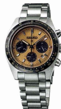
L'heure dorée Chronographe quartz solaire, Seiko, 680 €