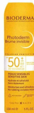
Ni vu ni connu Brume solaire invisible Photoderm, Bioderma, 11,90 €